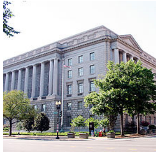
Edificio del IRS en Constitution Avenue, Washington, D.C..

El Servicio de Impuestos Internos (IRS) es el servicio de ingresos del gobierno federal de los Estados Unidos. La agencia gubernamental es una oficina del Departamento del Tesoro, y está bajo la dirección inmediata del Comisionado de Ingresos Internos, quien es nombrado por un período de cinco años por el Presidente de los Estados Unidos. El IRS es responsable de recaudar impuestos y administrar el Código de Impuestos Internos, el principal cuerpo de la ley fiscal legal federal de los Estados Unidos. Los deberes del IRS incluyen proporcionar asistencia tributaria a los contribuyentes y perseguir y resolver casos de declaraciones de impuestos erróneas o fraudulentas. El IRS también ha supervisado varios programas de beneficios, y aplica porciones de la Ley de Cuidado de Salud Asequible.